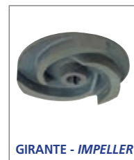
GIRANTE - IMPELLER