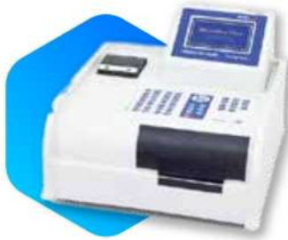
دستگاه الیزاریدر Eliza Reader

خوانشگر الیزا که به آن میکروپلیت ریدر نیز می گویند، نوعی اسپکتروفتومتر اختصاصی است و به منظور نمایش نتیجه آزمایش الیزا در آزمایشگاه های ایمنولوژی و سرولوژی (جهت کنترل ایمنی بدن) کاربرد دارد.