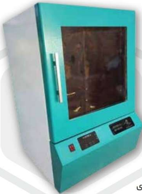
Full Digital Laboratory Refrigerated Incubator with Fan