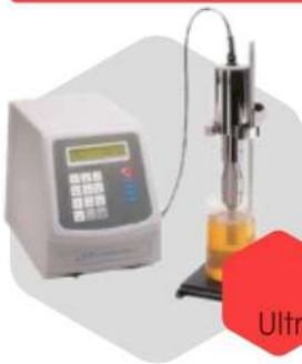
اولتراسونیک هموژنایزر Ultrasonic Homogenizer

دستگاه های مربوط به مخلوط کردن محلول و مایعات به منظور تبدیل مخلوط ناهمگن به همگن در انواع صنایع مربوط به رنگ و رزین، تولید مواد شوینده، غذایی، دارویی، آرایشی و بهداشتی و آزمایشگاه های زیستی، بیوتکنولوژی، تشخیص طبی و غیره کاربرد دارند و شامل میکسر های آزمایشگاهی، روتاتور یا رولر میکسر، شیکر و هات پلیت هستند.