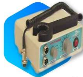
دستگاه رگ یاب Vein Finder Device

دستگاه کلنی کانتر یا شمارنده کلنی ها جهت شمارش باکتری ها و میکروارگانیسم ها (سلول های زنده) در محیط کشت بافت و سلول به منظور دست یابی به نتایج دقیق تر کاربرد دارد و در انواع آزمایشگاه های بیولوژیکی، زیستی، شیمیایی و غیره مورد استفاده قرار می گیرند.