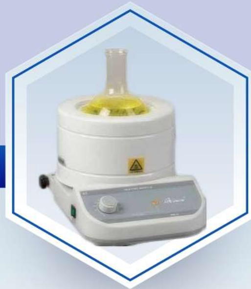
شوف بالون Laboratory Mantle

دستگاه مثل آزمایشگاهی یا شوف بالون جهت گرم کردن محلول هایی که لازم است به صورت غیر مستقیم تحت حرارت قرار بگیرند یا احتمال وقوع انفجار در آنها وجود دارد کاربرد دارند و در انواع صنایع دارو سازی و مواد شوینده و آزمایشگاه های شیمیایی، میکروبی و غیره مورد استفاده قرار می گیرند.