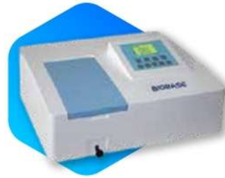
دستگاه اسپکتروفتومتر آزمایشگاهی Laboratory Spectrophotometer

خوانشگر الیزا که به آن میکروپلیت ریدر نیز می گویند، نوعی اسپکتروفتومتر اختصاصی است و به منظور نمایش نتیجه آزمایش الیزا در آزمایشگاه های ایمنولوژی و سرولوژی (جهت کنترل ایمنی بدن) کاربرد دارد.