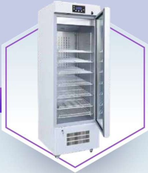
سرم وارمر Serum warmer

دستگاه سرم وارمر یا گرم کننده خون و مایعات به منظور گرم کردن نمونه ها و محلول های مورد استفاده در تزریقات وریدی و تجهیزات پزشکی به وسیله جریان هوای گرم تولید شده از طریق فن و هیتر کاربرد دارد و در مراکز درمانی و انواع آزمایشگاه های طبی و صنعتی مورد استفاده قرار می گیرند.