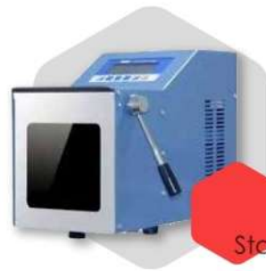
دستگاه استومیکر Stomaker Device

دستگاه استومیکر یا بلندر ضربه ای به منظور هموژن یا یکناخت کردن مواد غذایی در انواع تست های میکروبی و کنترل کیفی در محیط کشت آزمایشگاه های مربوطه و صنایع غذایی کاربرد دارد.