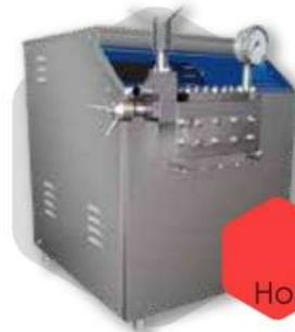
هموژنایزر Homogenizer Device

دستگاه اولتراسونیک هموژنایزر یا سونیکاتور جهت تبدیل جریان الکتریکی به ارتعاش مکانیکی و در نتیجه همگن سازی محلول در صنایع و آزمایشگاه های زیست شناسی، تحقیقاتی، کنترل کیفی، مواد غذایی و غیره کاربرد دارد.